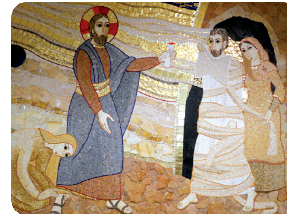
"La Comunidad Hospitalaria del Resucitado", retablo de la capilla del Centro

En 2010 se estrenó la nueva sala de rehabilitación del Centro, dentro del convenio de colaboración con Obra Social de Kutxa. La sala, que cuenta con un completo equipamiento, está destinada a mejorar la movilidad de los usuarios y estimular sus posibilidades motrices, así como a evitar un deterioro precoz de las mismas.